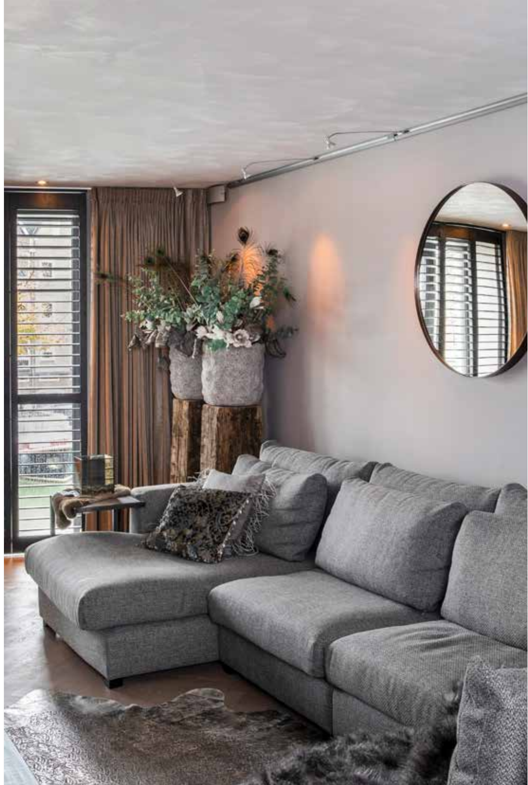
De XL loungebank is van het label By Miryam Schotman, met kussens van hetzelfde merk en van Designers Guild.