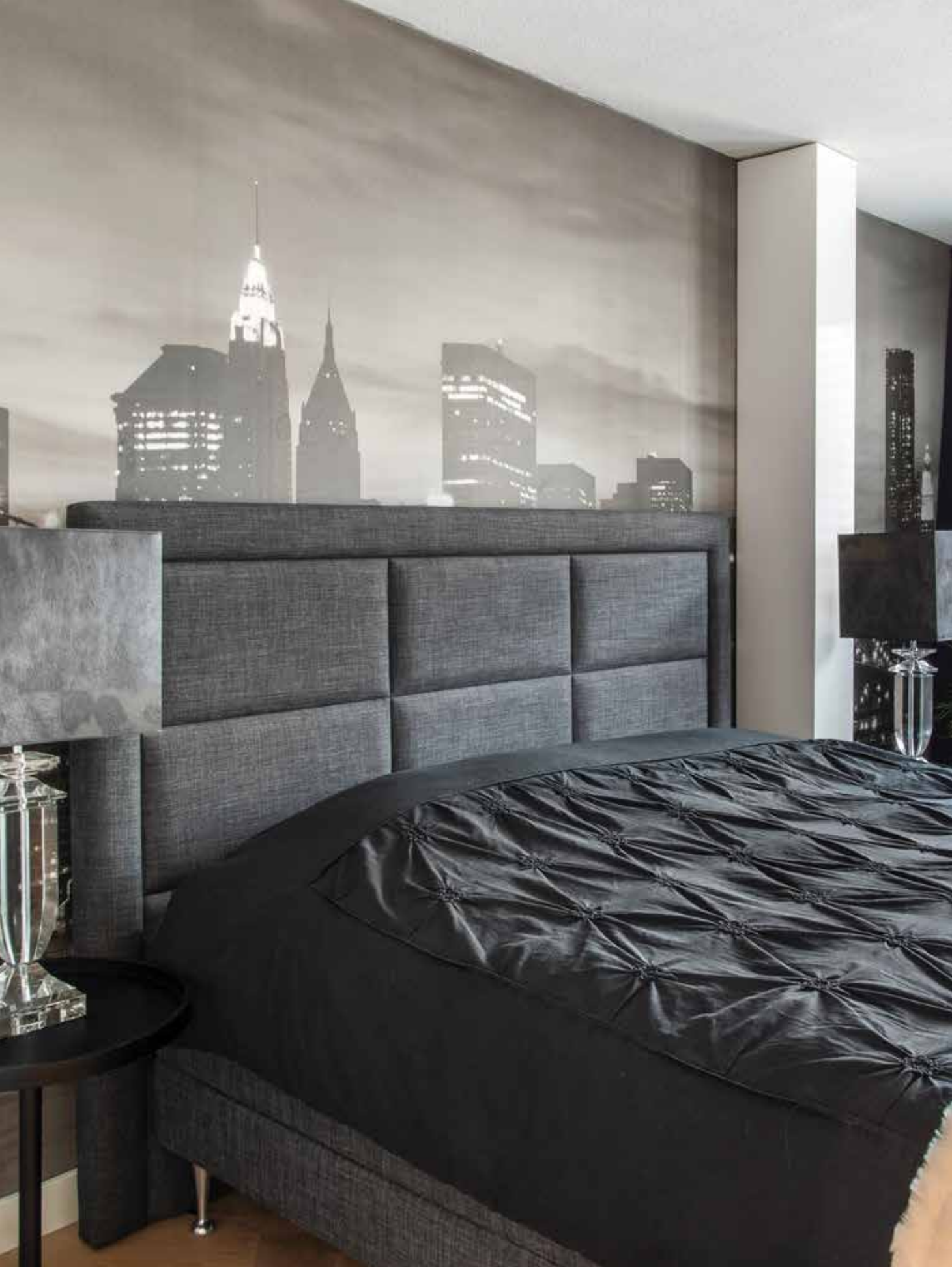
Behang is van Élitis, maar ook de lampenkappen zijn gemaakt van Élitis-behang, de lampenvoeten zijn van glas en komen uit de eigen collectie van Miryam Schotman Interieurs. Beddengoed is van Yellow, bed van Auping.