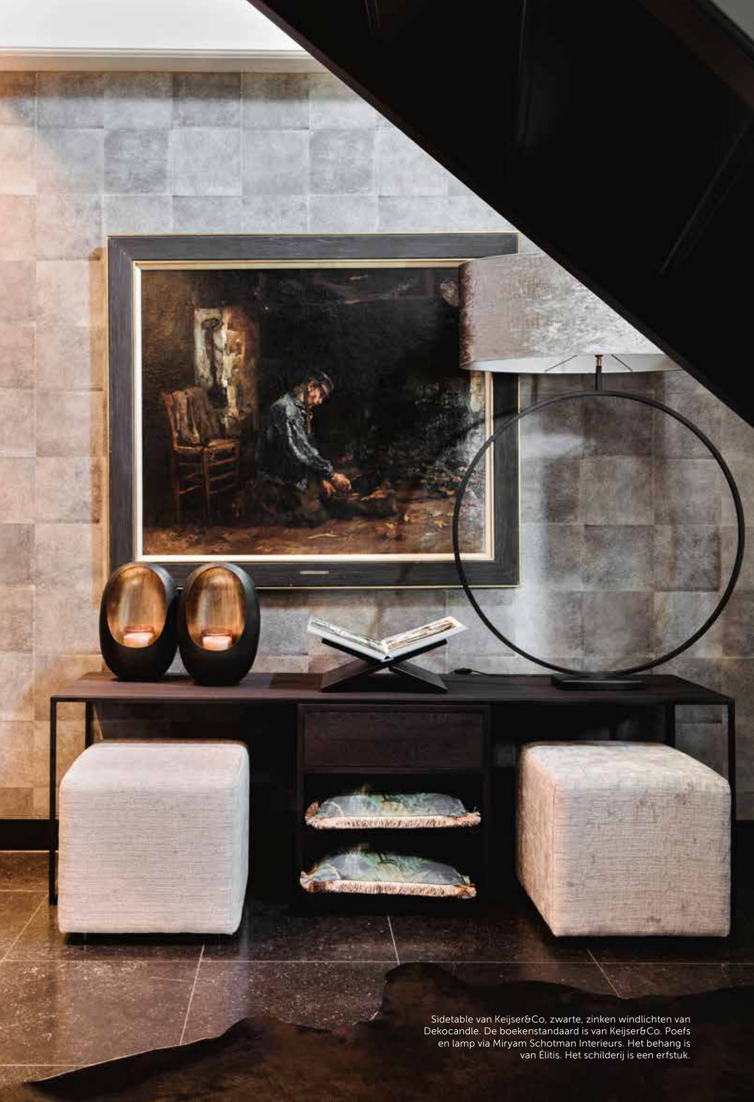
Sidetable van Keijser&Co, zwarte, zinken windlichten van Dekocandle. De boekenstandaard is van Keijser&Co. Poefs en lamp via Miryam Schotman Interieurs. Het behang is van Élitis. Het schilderij is een erfstuk.