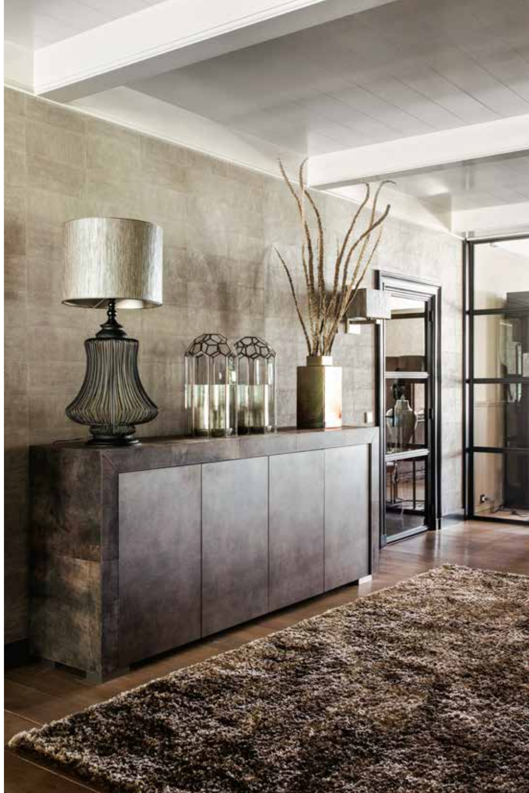
De voormalige deel is nu de eetkamer. Op de muur zit behang van Arte. Het dressoir is bij De Woonerije gekocht. Windlichten van O4Home en vaas van Mobach via De Watermolen. Het tapijt is gekocht bij Miryam Schotman Interieurs.

“TOEN ONZE KINDEREN NOG KLEIN WAREN, CROSTEN ZE ALTIJD OP HUN FIETSJES DOOR DE EETKAMER”